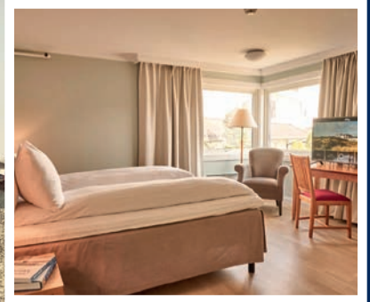
Sola Strand Hotel