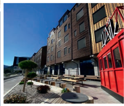
Scandic | Voss