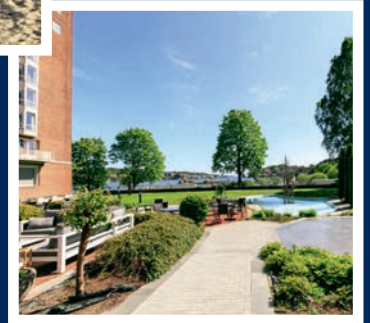
Scandic Park | Sandefjord

erreichen. Dennoch sollten Sie wasser- und windfeste Kleidung dabei haben und für kühlere Tage eine Kleidungsschicht aus Wolle.