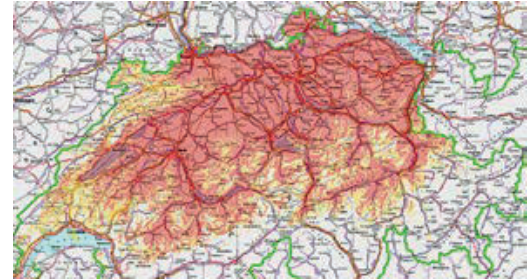
Über DAB+ empfangen 95 Prozent der Einwohnerinnen und Einwohner der Deutschschweiz unsere Programme.

Der kleine Aufwand des Umsteigens lohnt sich, denn mit den neuen DAB+-Radios begleiten wir Sie mit unseren Radioprogrammen rund um die Uhr – zu Hause, an die Arbeit oder auf Ihrer Reise von Basel bis zum Gotthard oder von St. Gallen bis Lausanne. Wir freuen uns, mit Ihnen unterwegs zu sein!